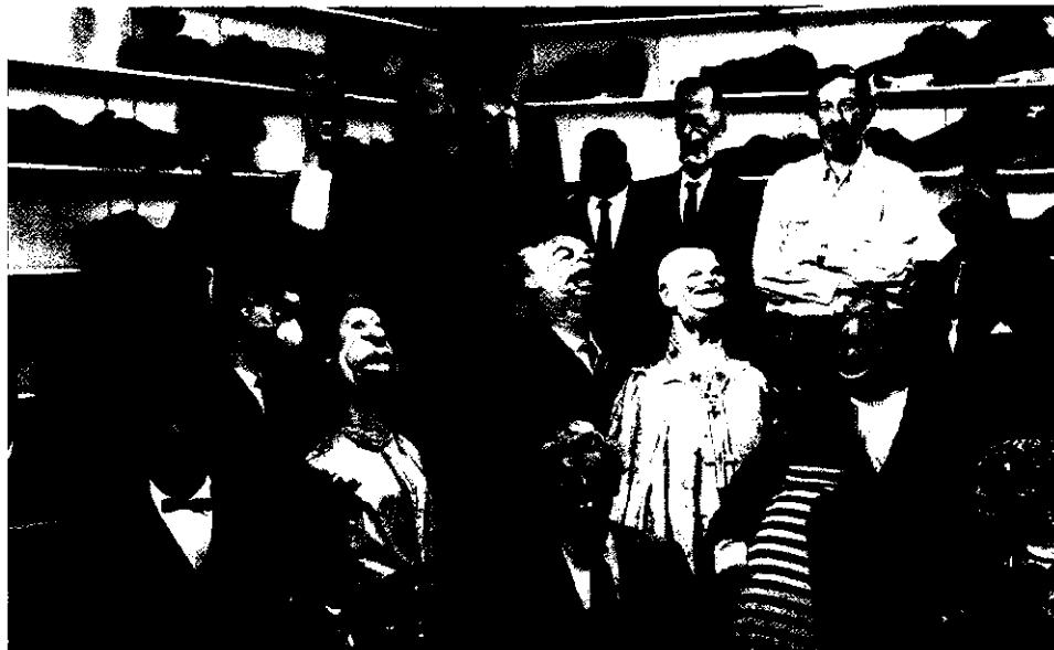
Spitting Image CENTRAL INDEPENDENT TELEVISION, 1985

Input 2004 FÓRUM 2004 BARCELONA Hasta el 28 de mayo www. input2004.org