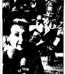
ROSA MARÍA CALAF Periodista

«Nadie publica una cinta de Bin Laden si antes no se ha difundido en las cadenas de EEUU»