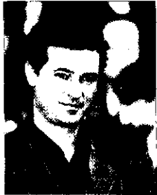
JULIO MEDEM Director de cine

«Aznar no ha ido nunca a visitar al lendakari, pero a Bush ha ido a verlo 12 veces»