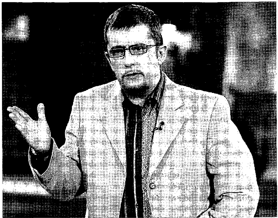
El programa Una altra cosa de TV3 ha estat seleccionat per a projectar-se en l'Input. / TV3

El comitè de l'Input ha escollit quatre produccions de l'Estat espanyol: Una altra cosa (TV3); Ratonones colorados (Canal Sur); La pelota vasca (ETB) i Cuéntame cómo pasó (TVE).